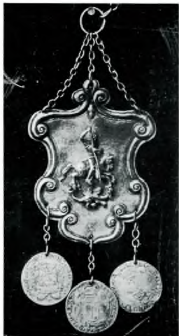
Foto: Het 17 e eeuwse zilveren schild van de St. Jorisschutterij te Wageningen, dat bij feestelijke gelegenheden door de schutterskoning werd gedragen.

Het begin van de avond zal gevuld worden met de JAARVERGADERING 1978, waarvoor men op blz. 10 de agenda vindt.