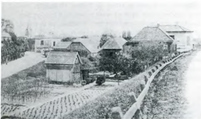
De Nude vanaf de dijk omstreeks 1900. Voorgrond: de werkplaats van Kuipers.

Als ik die heg zie, is er altijd een gedachten-associatie met onze hond toen, onze "Tjippie". Die was komen aanlopen, een klein pittig straat-hondje, geboren in de 'mennistenhuizen', maar erg lief en aanhankelijk. Wij maar zeuren om die hond te mogen houden, maar dat was moeilijk, want het was mobilisatie en distributie. En dat met 4 kinderen met een gezonde eetlust! De voorwaarde om hem te mogen houden was, dat wij in het vervolg van onze boterhammen de korstjes moesten afsnijden, die hij, geweekt met thee en een scheppy suiker er overheen, kreeg. Verder van een ieder een stukje vlees door zijn prak. Dat is altijd zo gebleven, ook toen de distributie was opgeheven. Maar ondanks het ontbreken van 'hapgrage vleesbrokken' was hij kerngezond en actief.