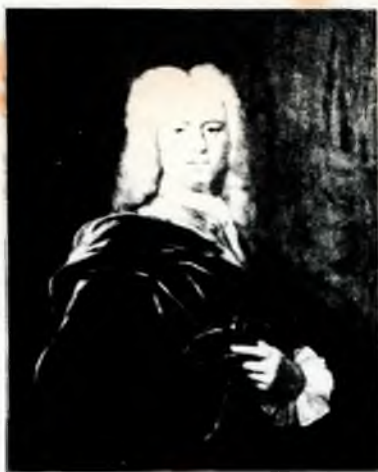
Lubbert Adolph Torck - 1738 - afgevoerd van Fortanella Wilhelmina van Oranje - Anonime afbeelding op Levenswag