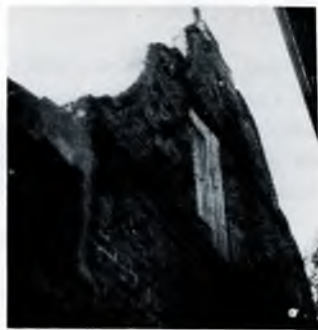
"Rust en Burgh" kort voor de afbraak in 1961