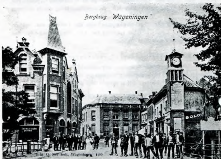
Boven: Tekening van de Bergpoort uit het jaar 1611. Onder: Zo zag dit zelfde punt er uit aan het begin van deze eeuw.