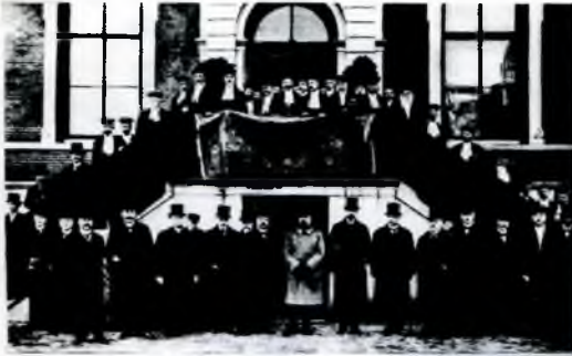
Prins Hendrik bij de opening van de Landbouwhogeschool op 9 maart 1918